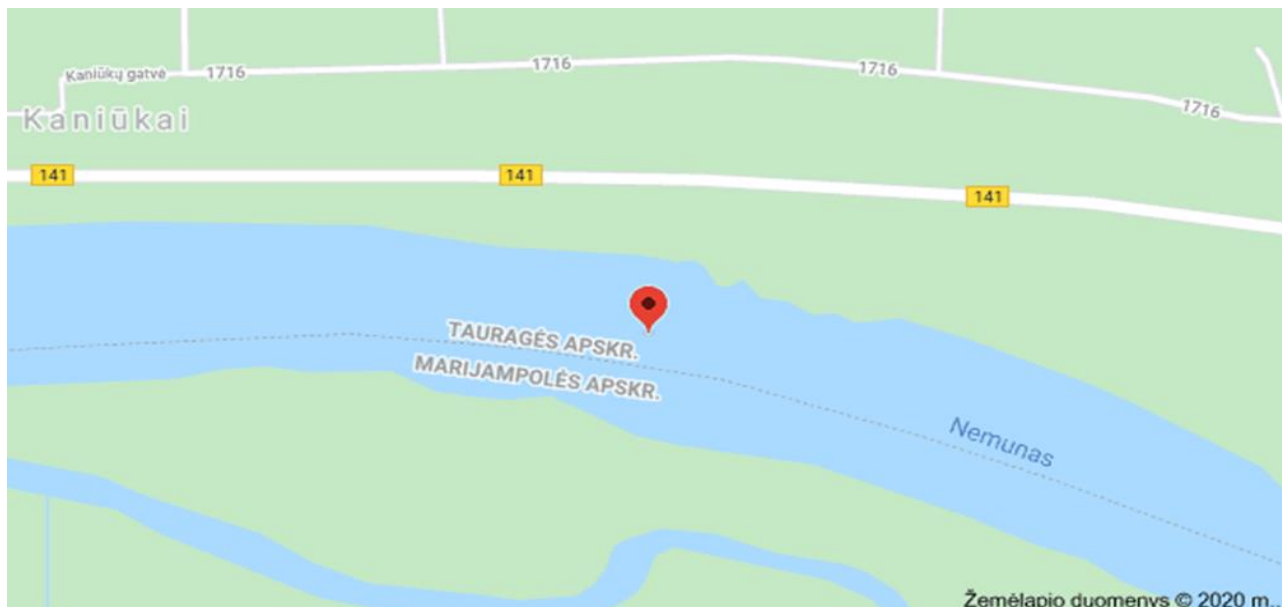
1 paveikslas. Žemsiurbės „Nemuno-11“, reg. Nr. VK-145, gilinimo darbų vieta