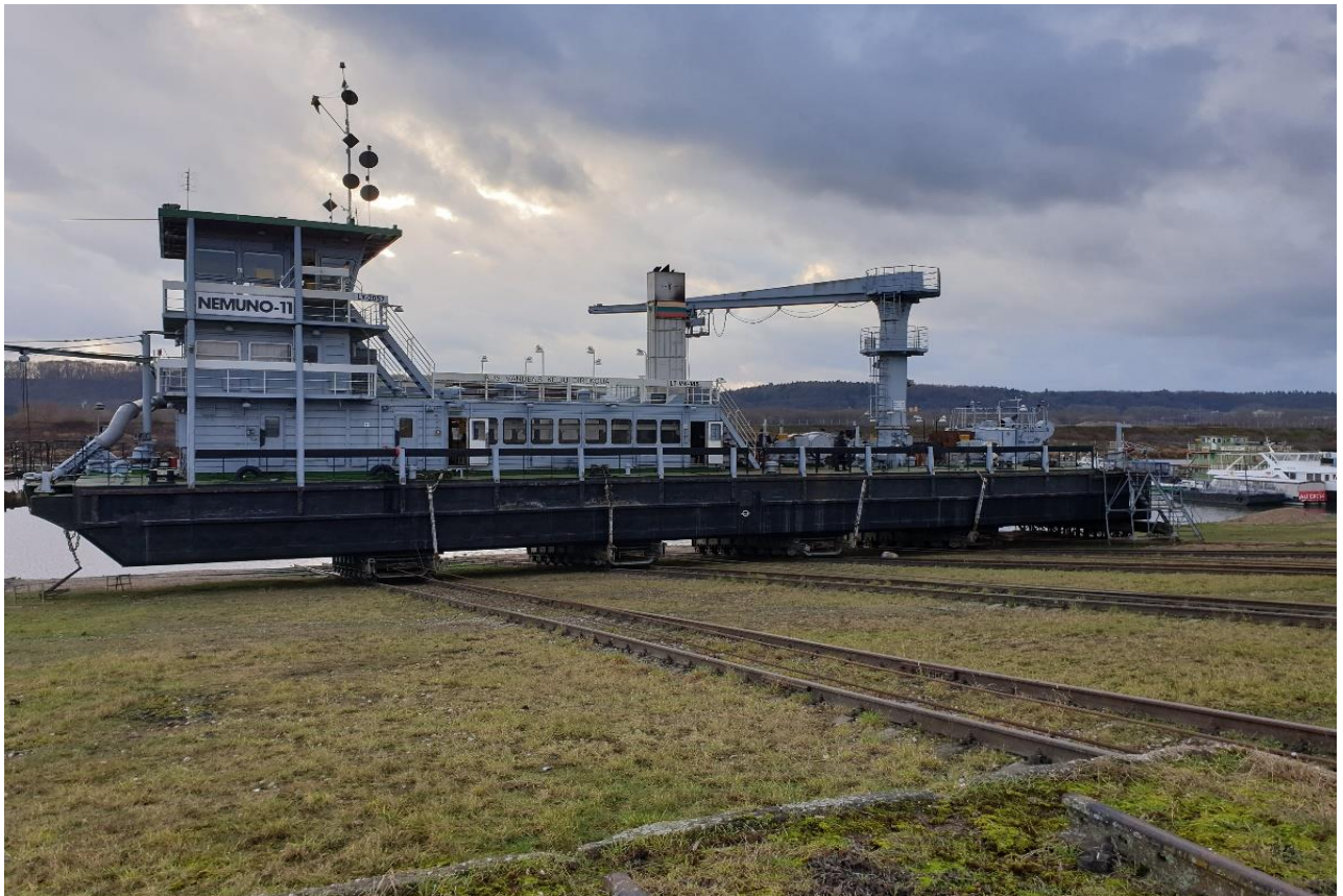
2 paveikslas. Žemsiurbė „Nemuno-11“, reg. Nr. VK-145