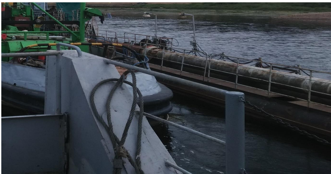
4 paveikslas. Pontonų pereinamasis tiltelis

Iš surinktos informacijos darytina išvada, kad einant per pontonų pereinamuosius tiltelius įgulos narys galimai įkrito į vandenį ir nuskendo.